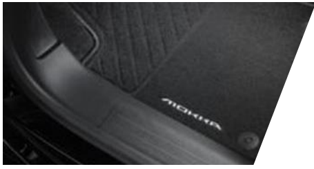
Súprava tvarovaných kobercov vpredu&vzadu Koberce Economy z extrémne odolného materiálu. Jemný čierny okraj a Mokka logo vpredu Číslo dielu: 1671152780 Cenniková cena: 64,8 €