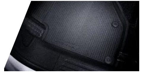
Súprava gumových tvarovaných kobercov -4ks Ochráni podlahu pred vlhkosťou, snehom a nečistotami. Nápis Mokka vpredu Číslo dielu: 1671152380 Cenniková cena: 67,63 €