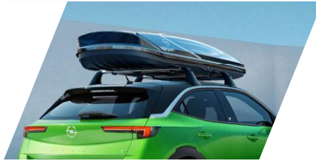
Strešný box Thule "Ocean 80," Elegantný strešný box praktického formátu. Rozmery: 133 x 86 x 37 cm. Objem: 320 l Číslo dielu: 1662444280 Cenniková cena: 289,40 €