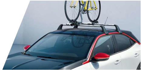
Strešný nosič bicykla Thule "Expert 298" Číslo dielu: 1642748780 Cenniková cena: 168,62 €