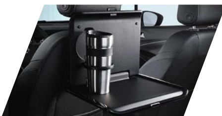
FlexConnect sklápny stolček potrebné objednať FlexConnect adaptér Číslo dielu: 13442006 Cenniková cena: 177,41 €