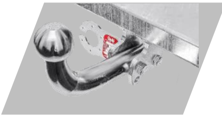
Ťažné zariadenie Galia Skrutkové prevedenie: 208€ Bajonetové prevedenie: 270,41 €