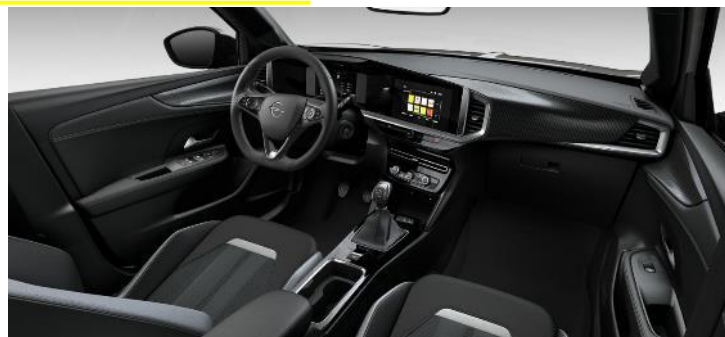
Čalúnenie kombinácia vinyl/látka GS, čierne Jet Black so strieborným dekorom, čierny strop (S9FT) – GS – 0 €