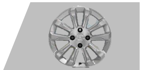
Disk z ľahkej zliatiny 16" strieborný Číslo dielu: 9835097280 Cenniková cena: 207,1 €