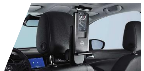
FlexConnect držiak tabletu (univerzálny) potrebné objednať FlexConnect adaptér Číslo dielu: 39092067 Cenniková cena: 231,23 €

Kompletnú ponuku príslušenstva nájdete na: OPEL PRÍSLUŠENSTVO