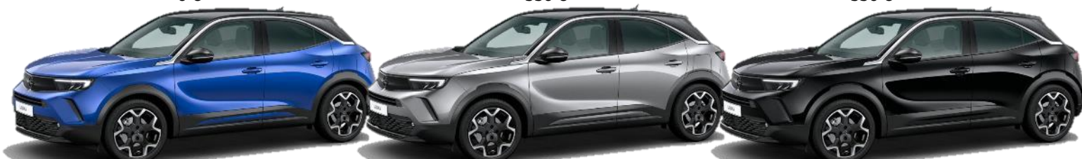
Modrá Voltaik (AVM0) 550 €