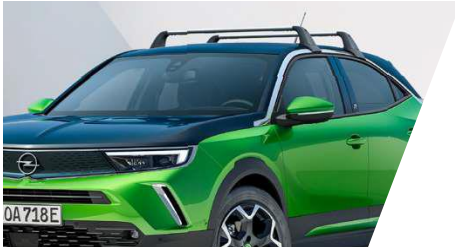
Priečne strešné hliníkové nosiče Sada 2 ks. aerodynamický hliníkový nosič, ľahká inštalácia, uzamykateľné uzávery, nosnosť strechy 75 kg. Číslo dielu: 9841125680 Cenniková cena: 343 €