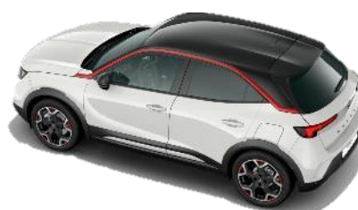
Sada Red – červené lišty okolo bočných okien, 18" dvojfarebné disky z ľahkých zliatin Diamond Cut s 5 lúčmi a červenými prvkami (S9FJ) GS 350 €