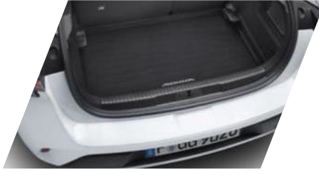
Vanička do batožinového priestoru, obojstranná Vanička s protišmykovou úpravou. Vrchná časť z čierneho koberca, spodná časť z čistiteľnej gúmy. Vysoký, stabilný okraj (30 mm) s nápisom Mokka. Číslo dielu: 9837878380 Cenniková cena: 106,81 €